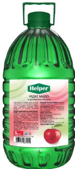
Жидкое мыло с ароматом яблока 5л