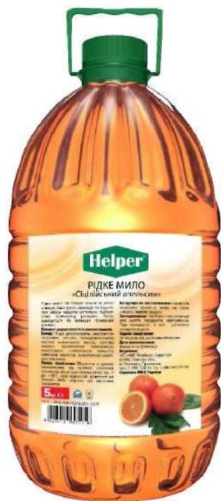
Жидкое мыло сицилийский апельсин 5л